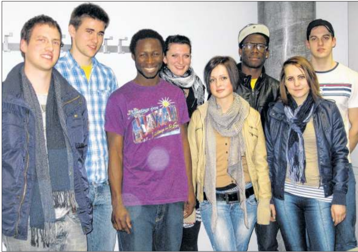
Die jungen Leute wehren sich gegen Diskriminierung beim Lokalbesuch.

Eine Gruppe junger Damen und Herren – der Großteil studiert an der Fachhochschule – wollten Ende Jänner das Fifty-Fifty besuchen. Neben einigen Skandinavien waren auch drei afrikanisch-stämmige Burschen dabei. Zwei besitzen einen österreichischen Pass.